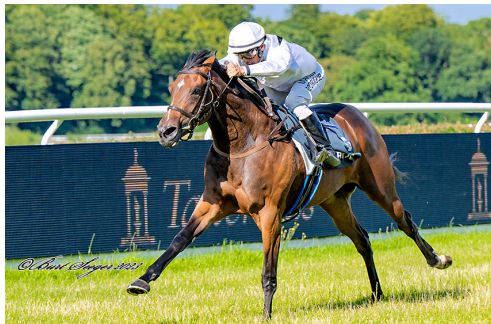
Sådan så det ud da Kis vandt Produces Stakes 2023.

Bedste lokale bud må være Marsk Torkdahl, som dog skuffede senest i København, men givetvis har for-