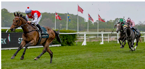
Lucien har fået programmets vindertip i JVB's 100 års Jubilæumsløb - Jydske Champion Stakes.

Bettina Andersens Lucien er programtipperens førstevalg. En hest som gør det godt hver gang og som