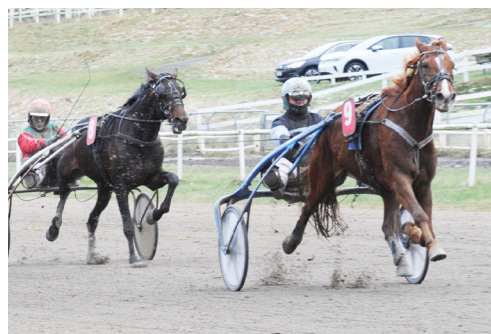
Futteflagfis har tidligere sejret adskillige gange på JVB. I dagens 6. løb spås hesten god chance for en ny triumf.

Vi ønsker alle god fornøjelse med Saturday Night Racing.