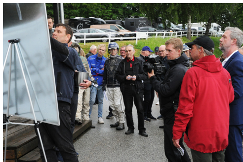
Et glimt fra sporvalgene til grand prixerne 20. juni.

Nedtællingen tog for alvor fart seneste løbsdag med kvalifikationsløbene til både Fair Finans Jydsk 4-årings Hoppe Grand Prix og Jydsk 4-årings Grand Prix. Vi kan kun opfordre til, at reservere lørdag d. 20. juni til et nyt besøg på Jydsk Væddeløbsbane. Det er nærmest garanti for spænding på højest niveau når derbyårgangens første storløb afgøres.